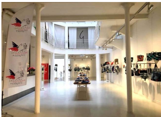
Les sacs en exposition chez agnes.b

Rappelez-vous : « Un sac acheté = un enfant qui part en vacances ». Eh bien, ça y est, beaucoup de ces petites merveilles de sacs à main, créations originales réalisées par les étudiants en stylisme de LISAA (L'Institut supérieur des arts appliqués) ont été vendues lors des deux jours chez agnès.b.